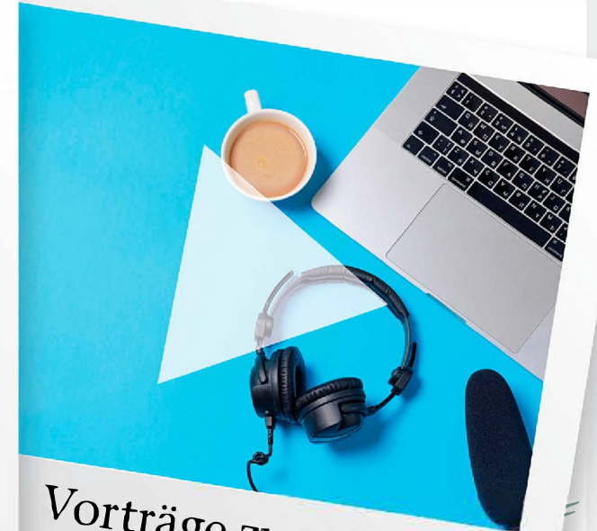
Vorträge zum Thema Gesundheit – Stress – Ernährung